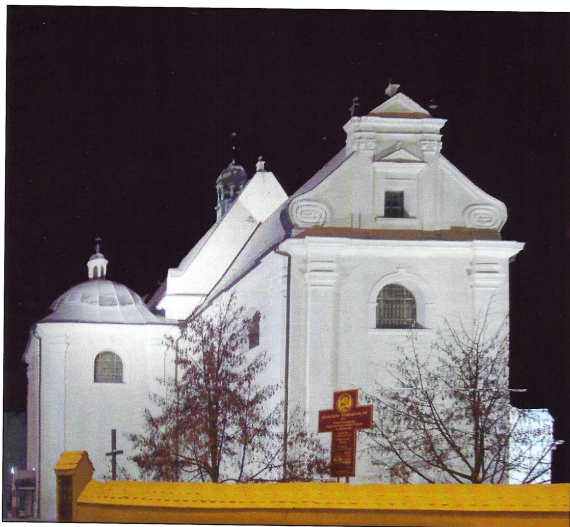
- Katholische Kirche Flatow bei Nacht - Erbaut 1648 -